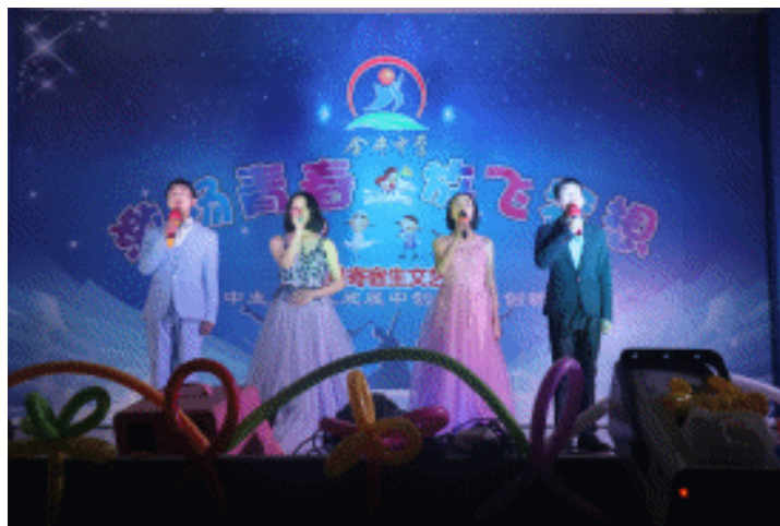
学校举行丰富多彩的文艺活动,为学生提供展现平台,助力学生身心健康成长。

2017年,金井中学在搞好常规管理优质化,优质常规常态化前提下,大力倡导“正本教育”,正心、正道、正直,促学生长远发展;本源、本来、本领,是学校育人的根本。并在学校开展致良知教育实践活动,努力培养孩子向上、向善之心,把善良一直践行下去。办学秉持耕读传家,诗书养性。一年来,学校“动静稳美”,为学生美好未来奠基,为未来社会培养美好公民。