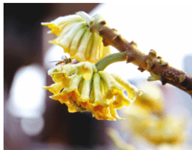
梦冬花开放，金色的小花一簇簇地放出光芒来。

一年之计在于春。这座城市的大街小巷，来来往往穿梭着忙碌的身影；乡村的田野里，承载着希望的种子随风飘扬；教室的课桌上，一本本新书等待着稚嫩的双手去采摘知识的果实。春天是一个充满希望的季节，莫与它擦肩而过，让我们伸出双手，拥抱春天。