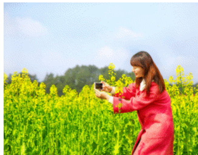
游人被成片成片的油菜花所吸引，停下脚步走入花丛中拍照留恋。