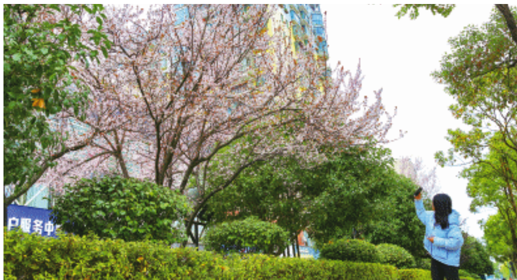
在星沙大道上，路旁的紫叶李盛开，路过的市民情不自禁地举起手机拍照。