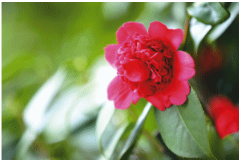
茶花鲜艳多彩，花姿卓越，芳香怡人。