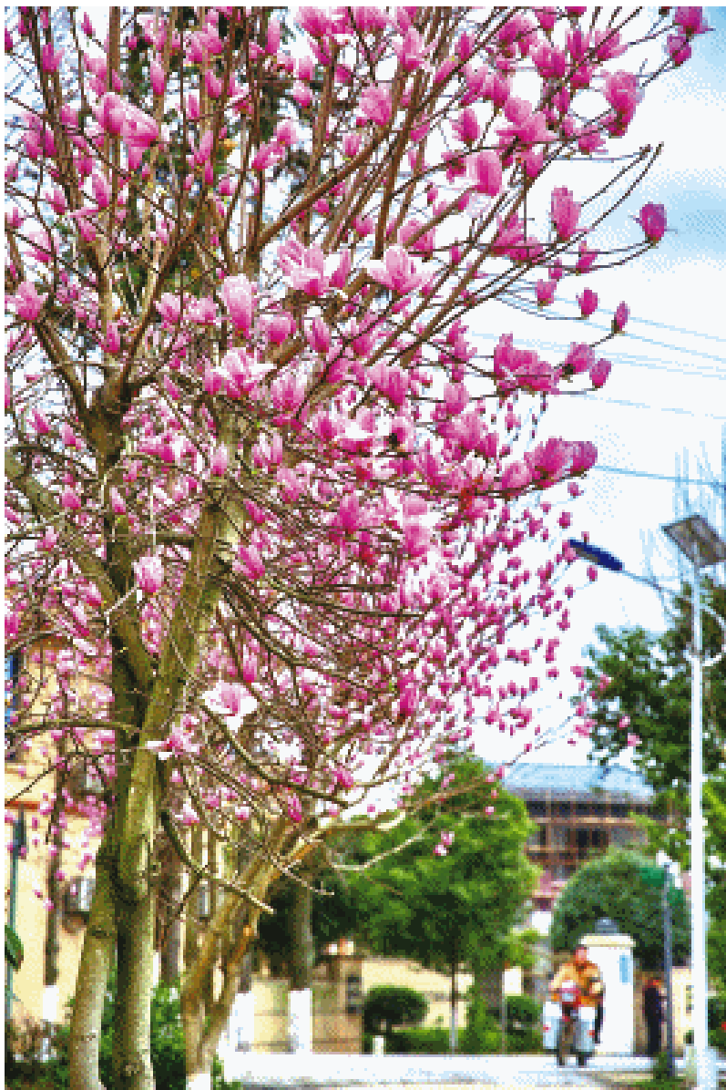
在长沙县金井镇，路旁的玉兰花已经“心急”地露出了美丽容颜，成为了一道靓丽的风景线。