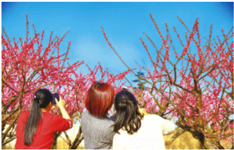
松雅湖国家湿地公园数千株梅花竞相开放。