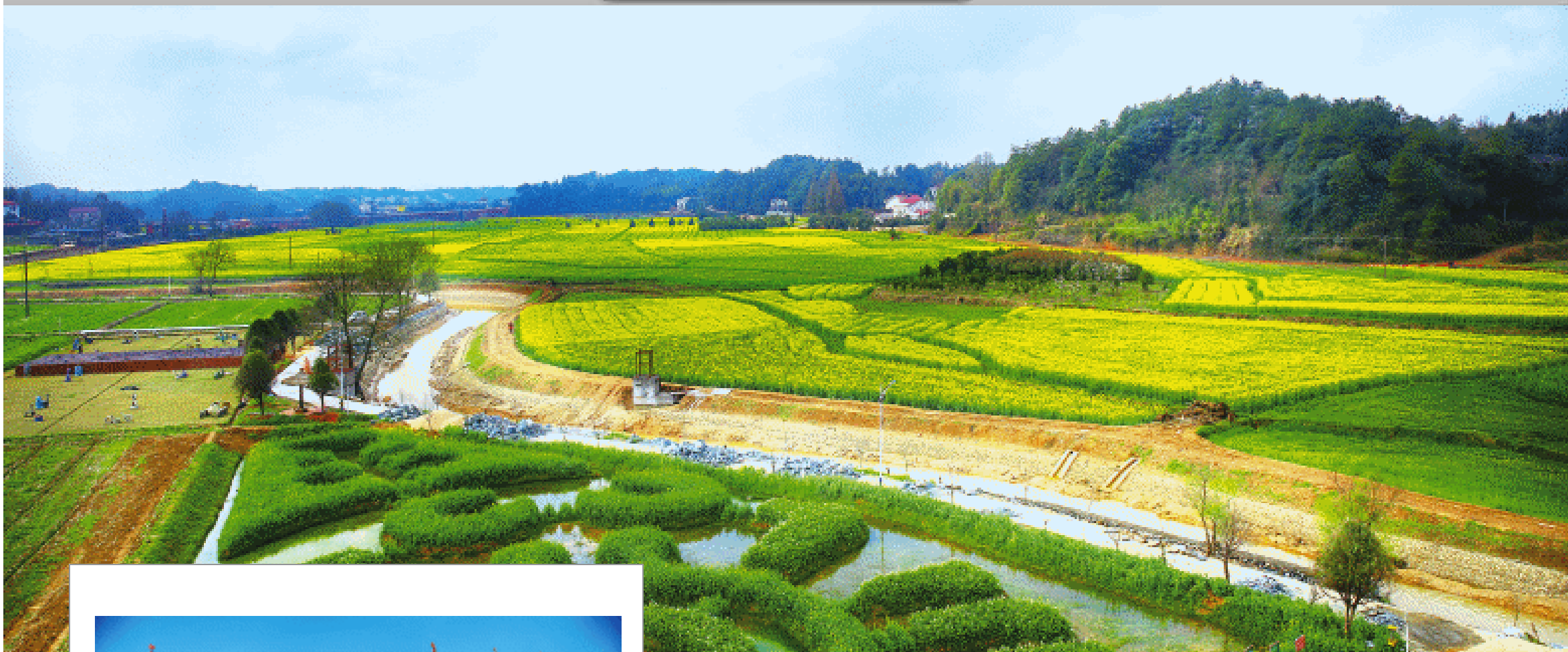
长沙县江背镇万亩油菜花已陆续盛放，蜂飞蝶舞、菜花飘香，正期待与游客们来一场春天的美丽邂逅。